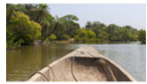
Casamance, el Senegal verde Exclusivo del programa Nomadas: Múltiple Casamance, el Senegal verde. Todos los contenidos de RNE en Series aquí, en RTVE Play

https://cadenaser.com/emisora/2020/03/25/ser_madrid_oeste/1585154711_460981.html